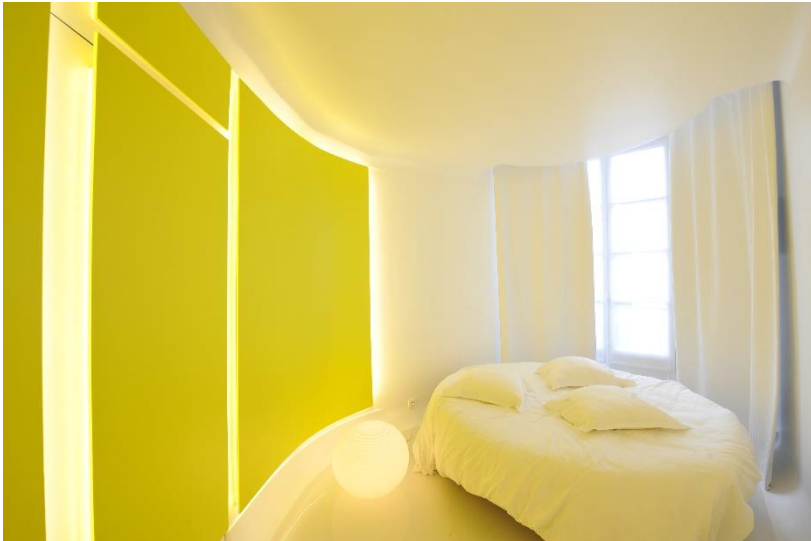
HÔTEL POMMERAYE / MICHA DERRIDER