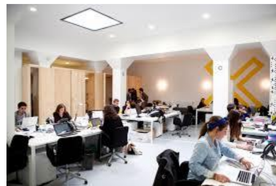
Les résidences d'artistes internationaux les Réels ICI Montreuil ouverts aux artistes et artisans Créatis, résidence d'entrepreneurs culturels, Paris – Gaîté L