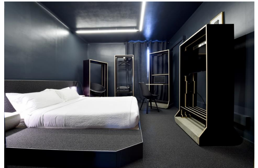
HÔTEL CAMBRONNE / SIMON THIOU