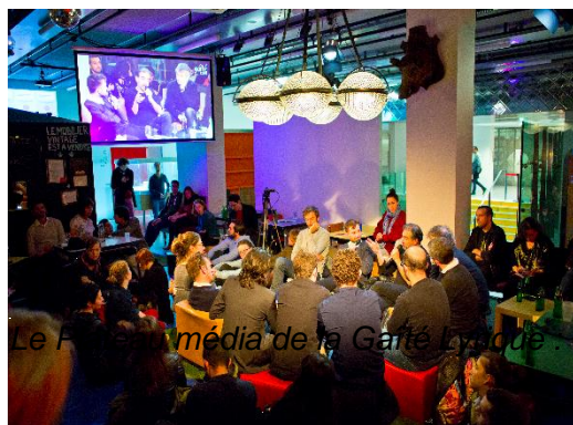
Le Festival média de la Gaîté Lyrique - coworking et conférence