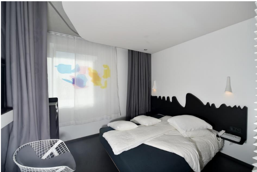
OKKO HÔTELS / JULIEN NÉDÉLEC