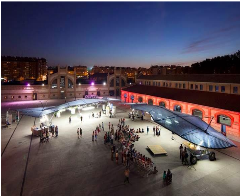
Créativité et convivialité en extérieur au Matadero, Madrid