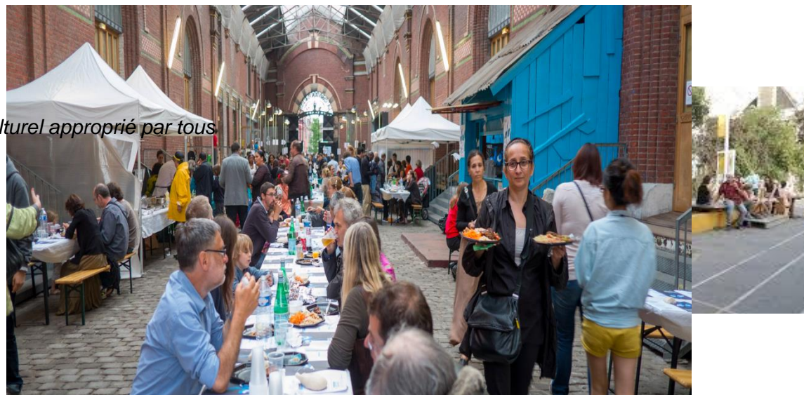
La Condition Publique, Roubaix : un équipement culturel approprié par tous