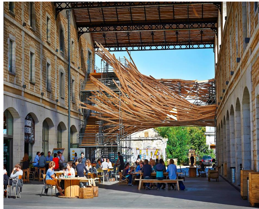
Idem à Darwin, Bordeaux