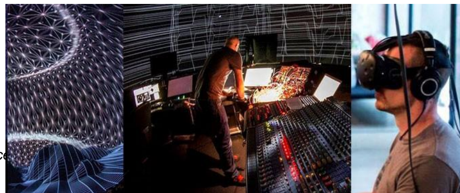
Les résidences croisées artistes – scientifiques de la SAT à Montréal